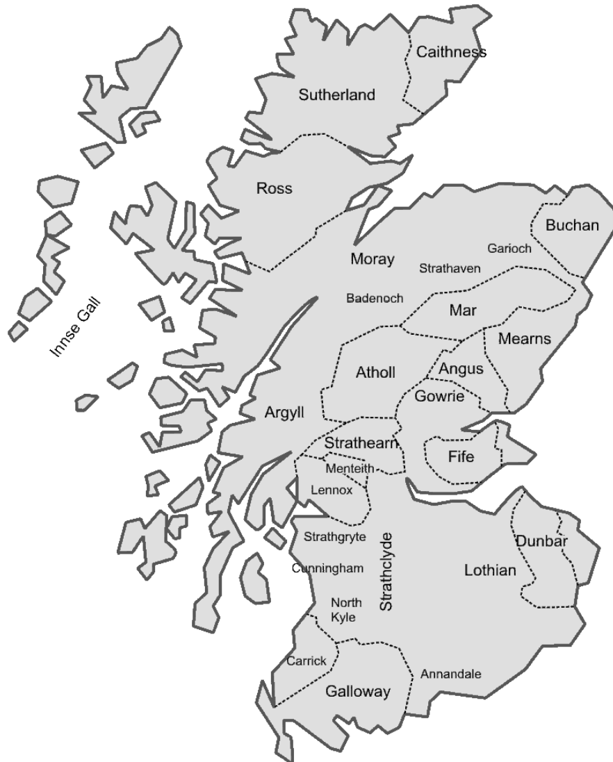
Шотландия (через 200 лет после Кнута)

Таким образом, шотландское направление приобрело видное место в политике Кнута Великого в связи с угрозой со стороны Олафа Святого. Правители, с которыми он установил вассальные отношения, были связаны с ключевыми регионами страны, к тому же они тесно контактировали с норманнами, расселившимися на островах, расположенных в непосредственной близости от Британии. Перейдя под власть Кнута, Шотландия смогла на время освободиться от внешней угрозы, что обеспечило благоприятные условия для становления единого государства.